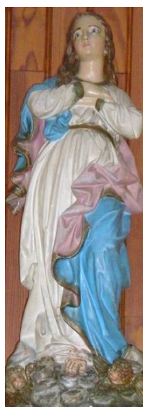
N-D. de Santa Cruz, P.P.N.