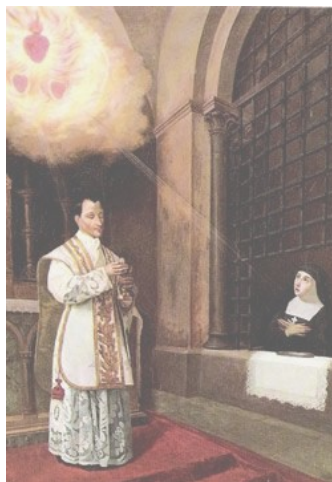
15 fév. : saint Claude de La Colombière