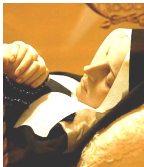
St e Bernadette dans sa chasse à Nevers

sa. 5 mars : pas de messe ni à 8h30 à Argelès, ni à 18h dans un village. Journée de recollection paroissiale d'entrée en carême au Carmel de Vinça