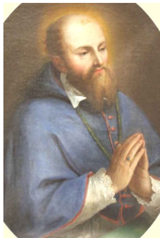
24 janvier, saint François de Sales, 21 août 1567- 28 déc. 1622