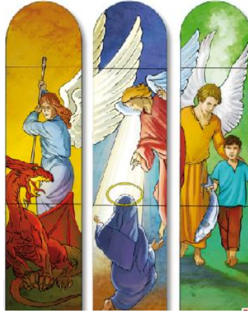
Mois de septembre, mois des saints archanges Michel, Gabriel et Raphaël