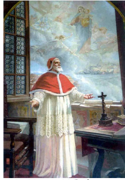
st. Pie V priant N-D. du Rosaire, le 7 octobre 1571, pour la victoire de Lépante

Pour recevoir cette feuille par courrier électronique, inscrivez-vous : martine9566@gmail.com Consultez aussi : www.paroisse-des-albères.com