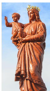
Statue monumentale du Puy N-D. de France, priez pour nous !